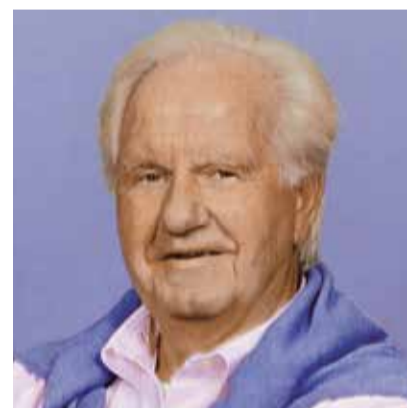
Rente Wester Secretaris verantwoordingsorgaan

Wij staan zoals altijd klaar om je vragen te beantwoorden